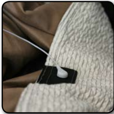
Couverture / plaid «doudou» 100x160 cm

Idéal lorsque nous sommes devant le téléviseur ou en train de lire.