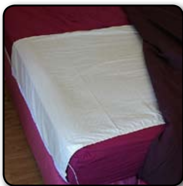
Demi-drap universel 90x300 cm

Parfaitement adapté pour les douleurs localisées et pour les sportifs. Les thérapeutes pourront également relier leurs patients à la terre.