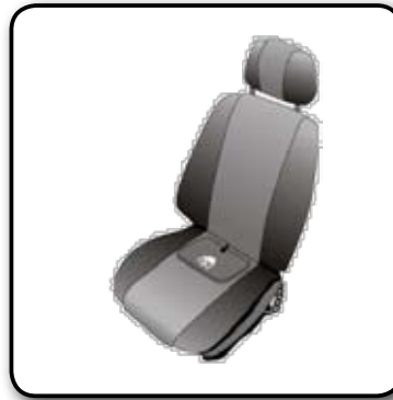
Tapis pour siège de voiture

Idéal lorsque nous sommes devant le téléviseur ou en train de lire.