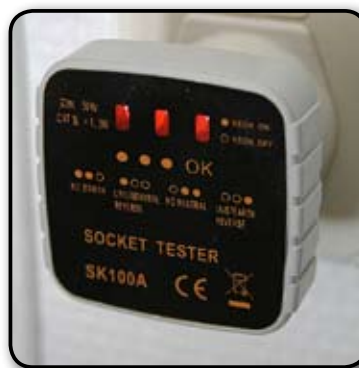
Testeur de terre

Peut se placer dans la largeur ou la longueur du lit selon sa taille. Permet de dormir en étant relié à la terre.